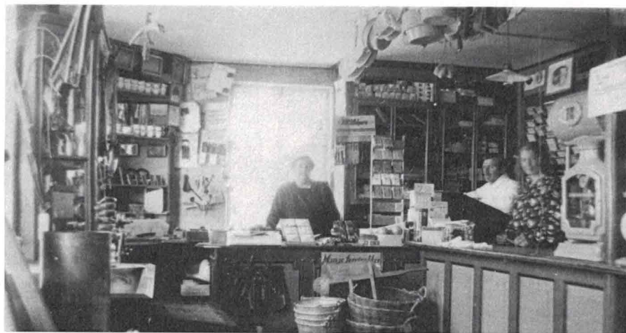
Ukendt fotograf, 1920

På billedet herunder ses brugsen fotograferet invendigt på denne tid.