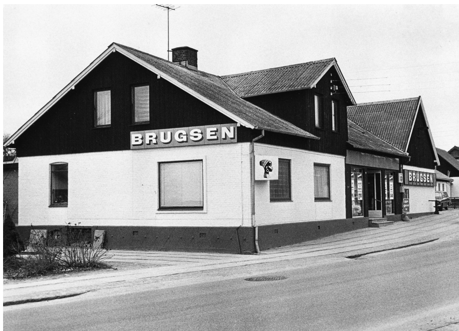
Ukendt fotograf, 1980