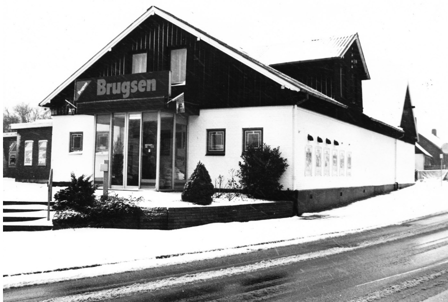
Fotograf: Leif Tychsen, Midtjyllands Avis, 1988